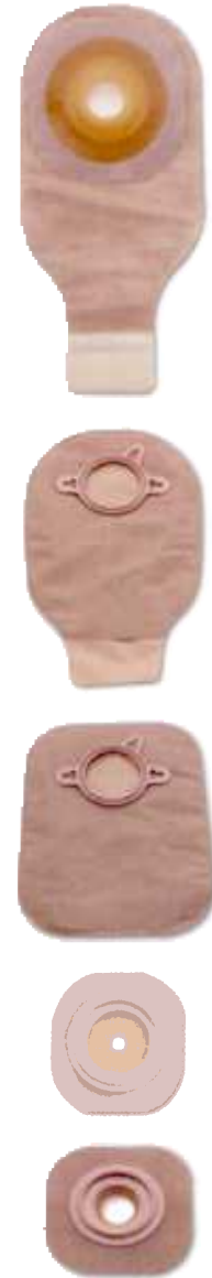
توضیح شکل از بالا به پایین کیسه یک تکه قابل تخلیه کیسه دو تکه قابل تخلیه کیسه دو تکه بسته چسب پایه تخت چسب پایه محدب

رنگ کیسه های کلتومی مات، روشن و سفید می باشد. جهت راحتی بیشتر می توانید از کیسه ای استفاده نمایید که دارای پوشش پارچه ای در سطح تماس با پوست می باشد. اگر مواد دفعی از استوما خمیری شکل باشند، پیشنهاد می شود از کیسه های فیلتر دار استفاده نمایید. فیلتر پس از فیلتره کردن بو، اجازه خروج گاز بدون بو را می دهد. بدین ترتیب از باد شدن کیسه در زیر لباس و احتمال پاره شدن آن، جلوگیری می شود.