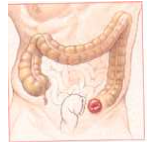
کلستومی دهانه‌ای است از کولون بر روی شکم که توسط عمل جراحی ایجاد می‌شود.

کلستومی دهانه ای است از کولون بر روی شکم که توسط عمل جراحی ایجاد می‌شود. هدف از عمل کلستومی، اجازه عبور مدفوع می باشد تا زمانی که بیماری یا بخش صدمه دیده روده بهبود یابد. در فردی که کلستومی دارد، مدفوع به جای مقعد از کلستومی خارج می‌شود. برای ایجاد کلستومی جراح قسمتی از کولون را از دیواره شکم بیرون می‌آورد. این دهانه تازه باز شده بر روی شکم را کلستومی می‌نامند. کلستومی می‌تواند در هر ناحیه از طول روده بزرگ ایجاد شود.